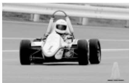
【2位】神奈川工科大学