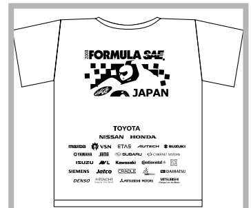
大会Tシャツ バックプリント共通