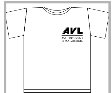
大会Tシャツ エイヴィエルジャパン提供