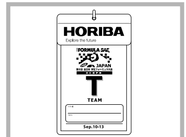
バスケース

(*1)Formula SAE Australasia(2008年11月、オーストラリア)で併催予定