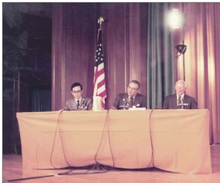
EPA マスキー法公聴会 (ワシントン/1971 年 5 月)