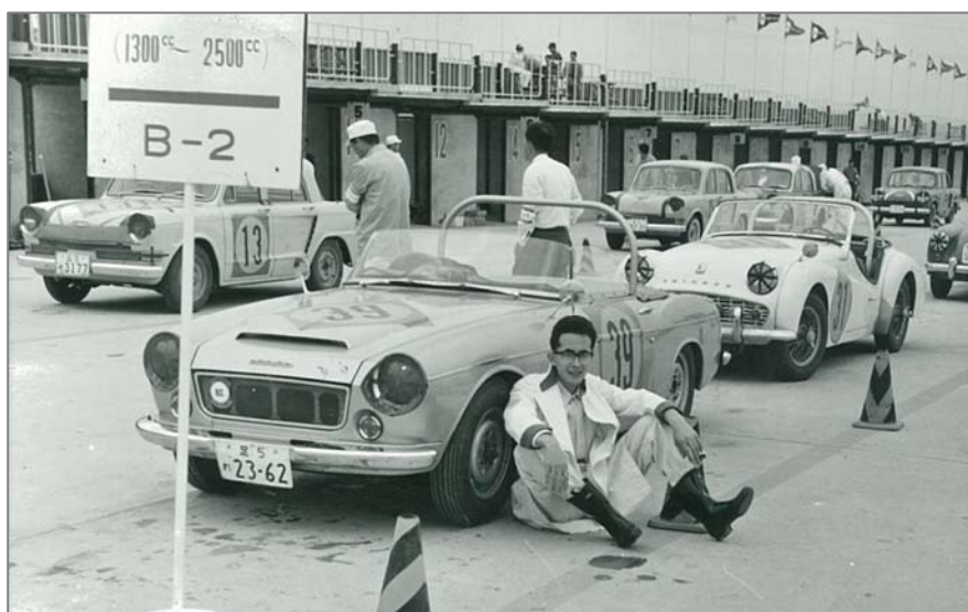
第 1 回日本グランプリ優勝のダットサン 1500 スポーツ (1963 年 5 月)

佐々木 まあ、それに近いと言えます。第 1 回でしたので、日産はその程度の支援しかしませんでした。トヨタさんはファクトリーに近い体