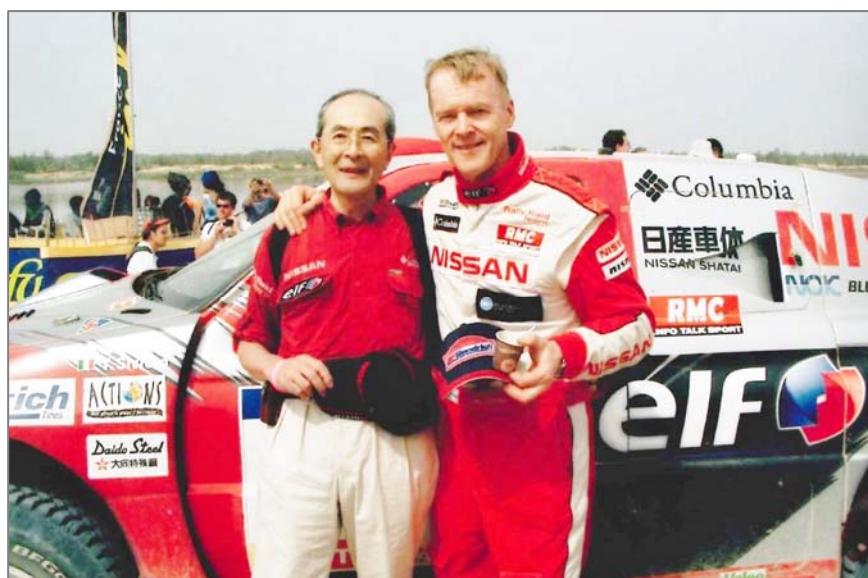
パリダカールラリー

モータースポーツを担当したときは、メインイベントはル・マンだったのですが、一番苦労したのは、本当のことを把握するのが大変難しかったこと