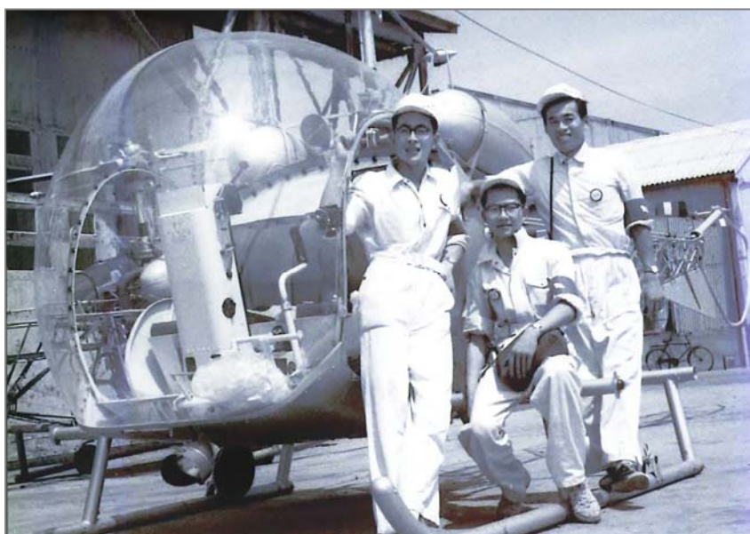
大学3年の実習(川崎重工岐阜工場/1958年7月)

でしょうか。それとも、いろいろなエンジンの中から、ホバークラフトにはターボファンが適しているということになったのでしょうか。